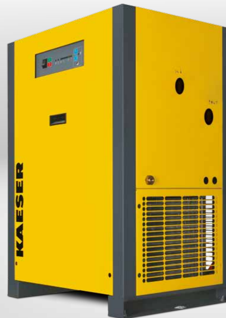
THP 40-50 Version standard